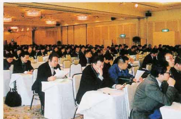
▲通常会員総会の様子