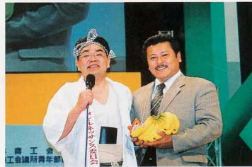
▲アトラクションの様子