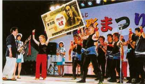
▲銭形踊りコンテスト会場

観音寺市では毎年夏の一大イベントとして「銭形まつり」を開催しています。このお祭りは、観音寺市のシンボルである銭形の砂絵にちなみ「銭形の街 かんおんじ」を広く全国に紹介するとともに、観光客の誘致を図り、産業・文化の発展に寄与することを目的として観音寺商会議所が発起人となって実施しており、今年で37回目を迎えようとしています。