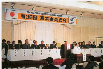
▲通常会員総会の様子