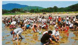
▲銭あざり大会の様子

そして、第31回日から商店街会場で「総おどり」に加えて、銭形の砂絵のある琴弾公園を舞台に、優勝賞金100万円の「銭形踊りコンテスト」、賞金総額100万円の潮干狩り型宝探しゲーム「銭あざり大会」など、観音寺らしい参加型のイベントが誕生しました。おかげさまで昨年は約5万6千人の方にご来場いただきました。現在、我がYEGは「銭形踊りコンテスト」と「花火」を担当しています。今年も、来る7月20日(海の日)に開催することが決定しました。現在出場チームを募集しております。あなたの町からも、賞金目指して参加してみませんか?