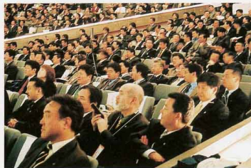
▲パネルディスカッションの様子