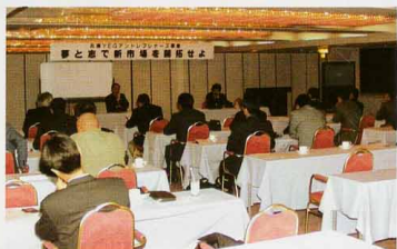
▲セミナー会場の様子

北関東三県(茨城・栃木・群馬)の県青年部連合会全国各地のYEGでも「若手後継者等育成補助金」を受けとられる事と思いますが、兵庫県商青連も平成13年度、同補助金を受けて「兵庫YEGアントプレナーズ事業」を実施してきました。商青連主催の京都セミナーへの参加を含めて5回のセミナー開催という内容ですが、京都以外はすべてオリジナルの企画でシリーズ展開のセミナーです。毎回、テーマに基づく基調講演の他に、実際に事業を起し成功されている社長をお招きして講演をいただきました。さらに「聞くだけ」では深まりが無いとの判断から、各回の最後には講師やゲスト社長と意見を交換し合う時間を充分に取り、自己啓発を図ってきました。さらに次年度以降も継続実施の予定です。