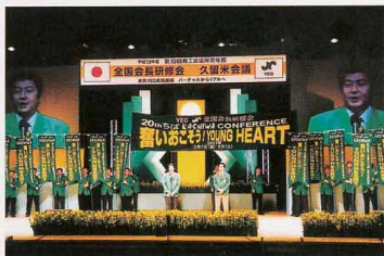
▲次年度柏会議PRの様子

若き経済人が、夢語った。仲間の顔が見えてきた。みんなの思いが、聞こえてきた。「久留米会議」！